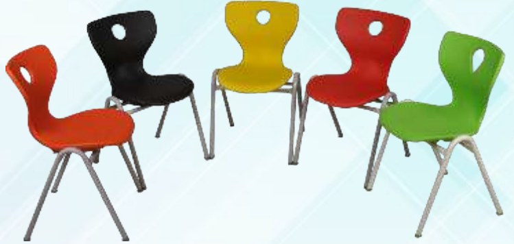
Monoblok A ayak sandalye Monoblock chair with metal A Leg