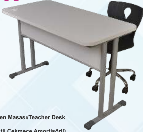
60 X 120 Öğretmen Masası/Teacher Desk

Ahşap Tabla , Kilitli Çekmece Amortisörlü , Tekerlekli Monoblok Sandalye