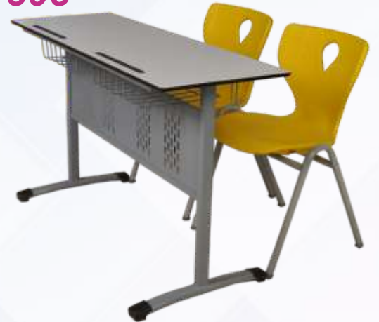
45 X 120 Çift Kişilik Öğrenci Sırası / Double Student Desk

Kompakt Tabla , Masa Önü Metal Perdeli , Tel Kitaplık Monoblok A Ayak Sandalye