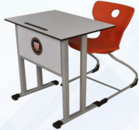
50 X 70 Tek Kişilik Öğrenci Sırası / Single Student Desk Kompakt Tabla , Masa Önü Ahşap Perdeli , Tel Kitaplıklılı Monoblok Z Ayak Sandalye Compact table with metal legs , wooden close front , metal bookcase Monoblock chair with metal Z Leg