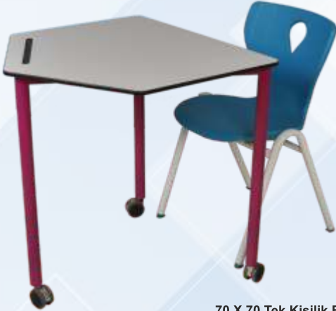
70 X 70 Tek Kişilik Beşgen Öğrenci Sırası / Single Pentagonal Student Desk

Kompakt Tabla , Frenli Tekerlekli Ayak Monoblok A Ayak Sandalye