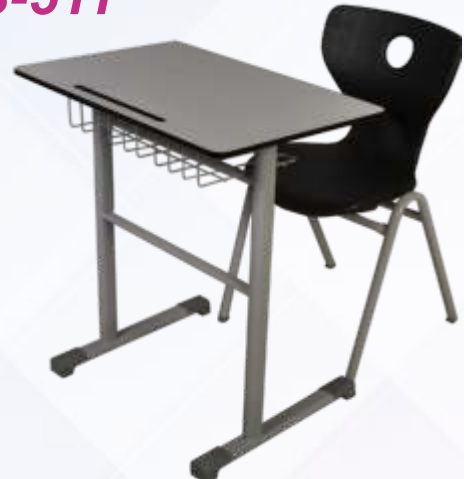
50 X 70 Tek Kişilik Öğrenci Sırası / Single Student Desk Kompakt Tabla Monoblok A Ayak Sandalye Compact table with metal legs Monoblock chair with metal A Leg