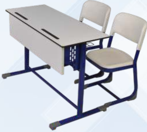
45 X 120 Çift Kişilik Öğrenci Sırası / Double Student Desk

Kompakt Tabla , Masa Önü Ahşap Perdeli , Tel Kitaplık Metal Ayaklı Polypropylen Sandalye