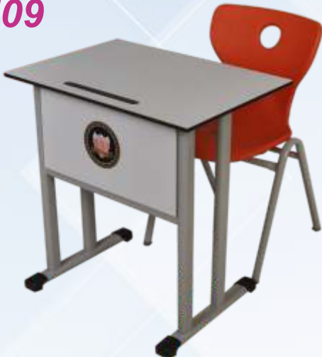
50 X 70 Tek Kişilik Öğrenci Sırası / Single Student Desk Kompakt Tabla , Masa Önü Ahşap Perdeli , Tel Kitaplıklılı Monoblok A Ayak Sandalye Compact table with metal legs , wooden close front , metal bookcase Monoblock chair with metal A Leg