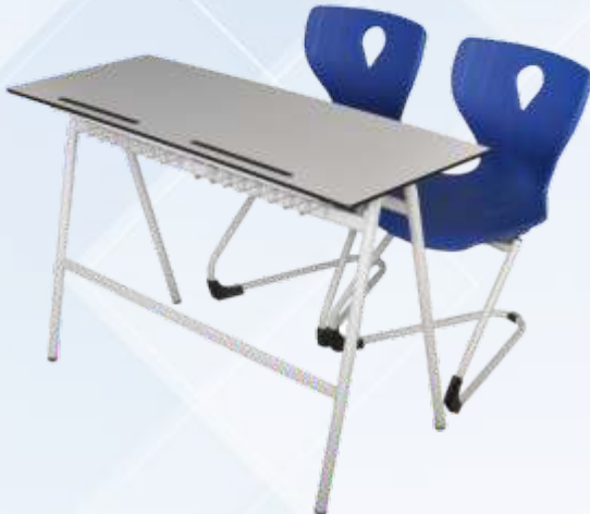
45 X 120 Çift Kişilik Öğrenci Sırası / Double Student Desk