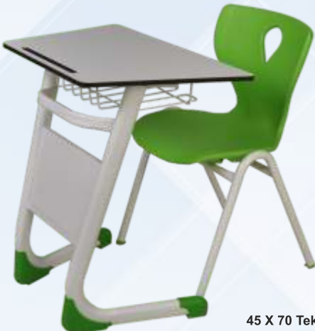
45 X 70 Tek Kişilik Konik Öğrenci Sırası / Single Pentagonal Student Desk

Konik Kompakt Tabla , Masa Önü Ahşap Perdeli Monoblok A Ayak Sandalye