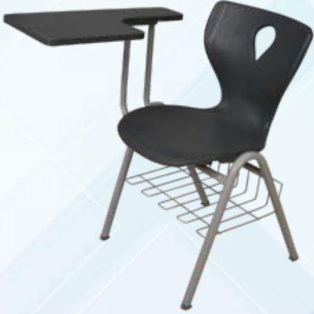
Monoblok Seminer Sandalyesi A Ayak , Ahşap Yazma Tahtası , Oturak Altı Metal Sepet Monoblock Seminary Chair with metal A Leg Wooden Writing Tablet , metal bookcase under seat