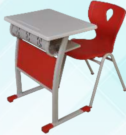
45 X 63 Tek Kişilik Öğrenci Sırası/ Single Student Desk Werzalit Tabla , Masa Önü Ahşap Perdeli , Metal Kitaplıklılı Monoblok A Ayak Sandalye Werzalit table with metal legs , wooden close front , metal bookcase Monoblock chair with metal A Leg