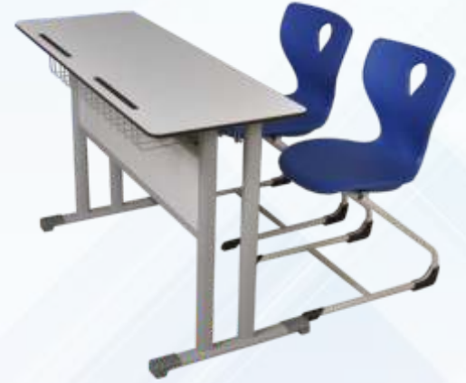
45 X 120 Çift Kişilik Öğrenci Sırası / Double Student Desk

Kompakt Tabla , Masa Önü Ahşap Perdeli , Tel Kitaplık Monoblok Z Ayak Sandalye