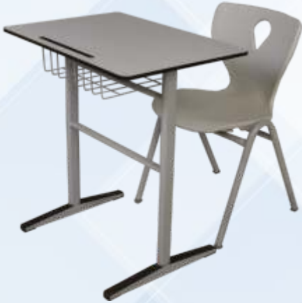
50 X 70 Tek Kişilik Öğrenci Sırası / Single Student Desk Kompakt Tabla , Pres Baskılı U Ayak , Tel Kitaplıklılı Monoblok A Ayak Sandalye Compact table with pressed metal U leg , metal bookcase Monoblock chair with metal A leg