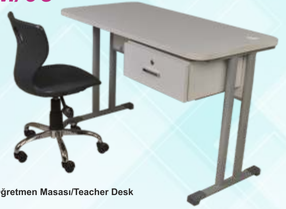
60 X 120 Öğretmen Masası/Teacher Desk

Ahşap Tabla , Kilitli Çekmece Amortisörlü , Tekerlekli Monoblok Sandalye