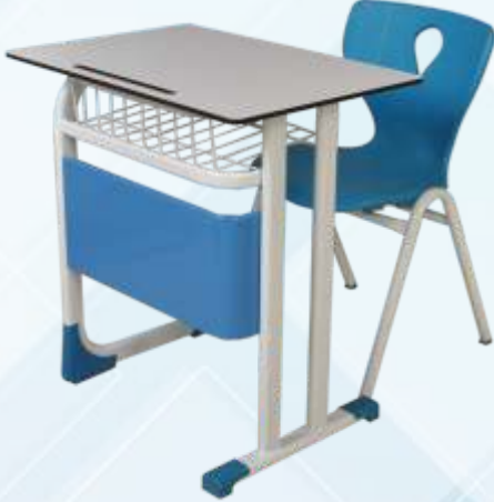
50 X 70 Tek Kişilik Öğrenci Sırası/ Single Student Desk Kompakt Tabla , Masa Önü Metal Perdeli , Tel Kitaplıklılı Monoblok A Ayak Sandalye Compact table with metal legs , metal close front metal bookcase Monoblock chair with metal A leg